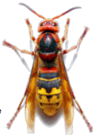
Frelon européen (taille réelle 4cm)