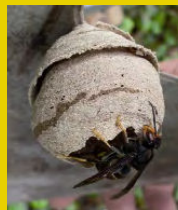
Nid primaire du frelon asiatique