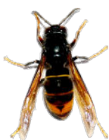
Frelon asiatique (taille réelle 3cm)

Ce redoutable prédateur s'attaque à toutes sortes d'insectes, mais principalement aux abeilles, maillon indispensable dans la chaîne alimentaire !